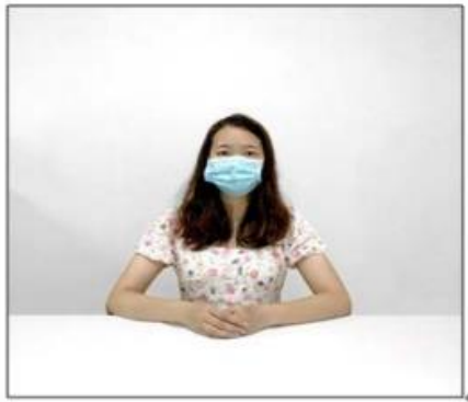
图2：正前方第一机位效果图。