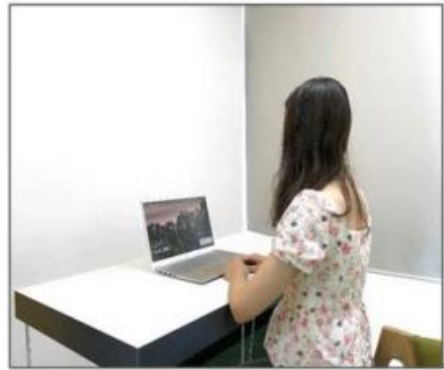
图3：侧后方第二机位效果图。

第二机位设备仅用于监测考试环境，请保证其不会对笔试和面试造成干扰。手机作为第二机位“加入会议”后，在“更多”界面“断开音频”，避免多设备啸叫，如下图所示：