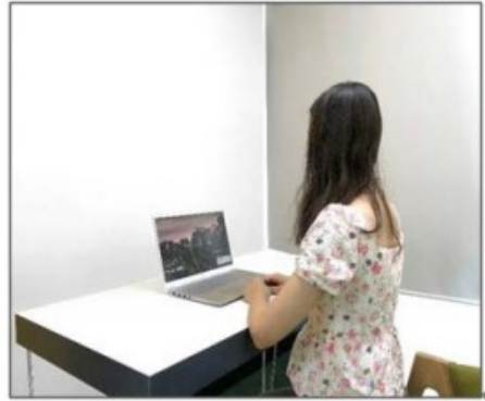
图3：侧后方第二机位效果图。

第二机位设备仅用于监测考试环境，请保证其不会对复试造成干扰。手机作为第二机位“加入会议”后，在“更多”界面“断开音频”，避免多设备啸叫，如下图所示：