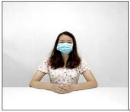
图2：正前方第一机位效果图。