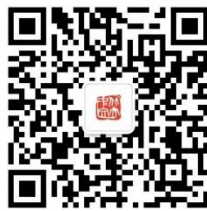
“北京大学中文系”微信二维码

请取得复试资格的考生安装微信应用，在 2023 年 3 月 21 日中午 12:00 前将“北京大学中文系”加为微信好友。加好友时须发送： 专业+姓名+身份证件号 ，方可通过验证。逾期不加好友者，影响复试联络通知，后果自负。