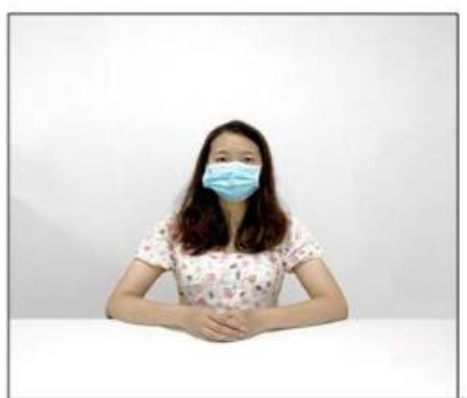
图2：正前方第一机位效果图