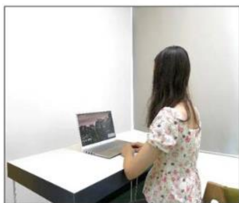
图3：侧后方第二机位效果图

第二机位设备仅用于监控考试环境。请务必保证第二机位设备不会对面试造成干扰。如使用手机作为第二机位，应保证面试不被来电